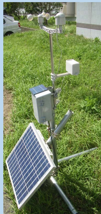
KOSEN版ウェザーステーション